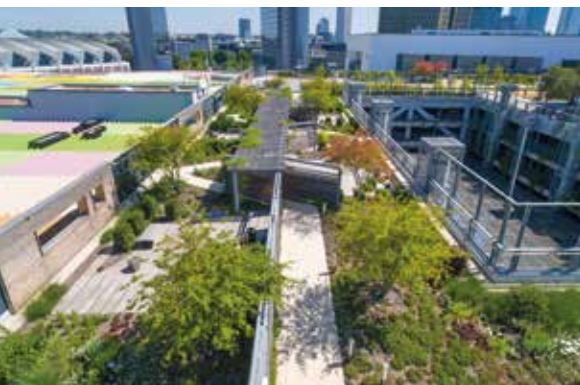
Das Dach als Freizeitfläche

Es entstehen Freizeitflächen und Aufenthaltsbereiche von denen alle profitieren: die Bewohnerinnen und Bewohner strukturreicher grüner Stadtteile, die Angestellten in Ihren Unternehmen, in der Pause und auf dem Weg zur Arbeit und nebenbei auch Pflanzen und Tiere, denn neues Grün trägt zusätzlich zur Erhaltung der Artenvielfalt bei.