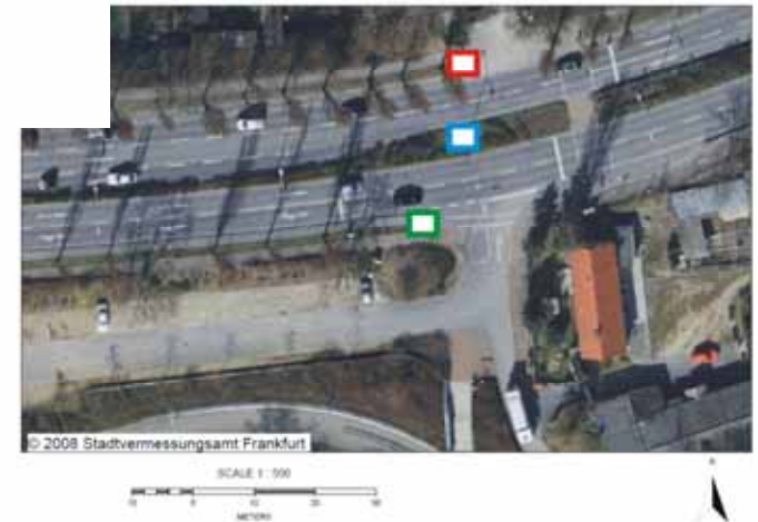
5 Deutscherhof / Gerbermühlstraße