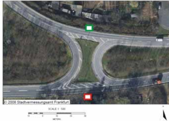
30 Gulluststraße / A 5 (Griesheimer Platzweg)